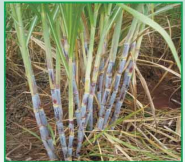
CVSO07-7870 – 6 meses

estratégia de melhoramento praticada pela CanaVialis, que visa um melhoramento regionalizado, está no caminho certo.